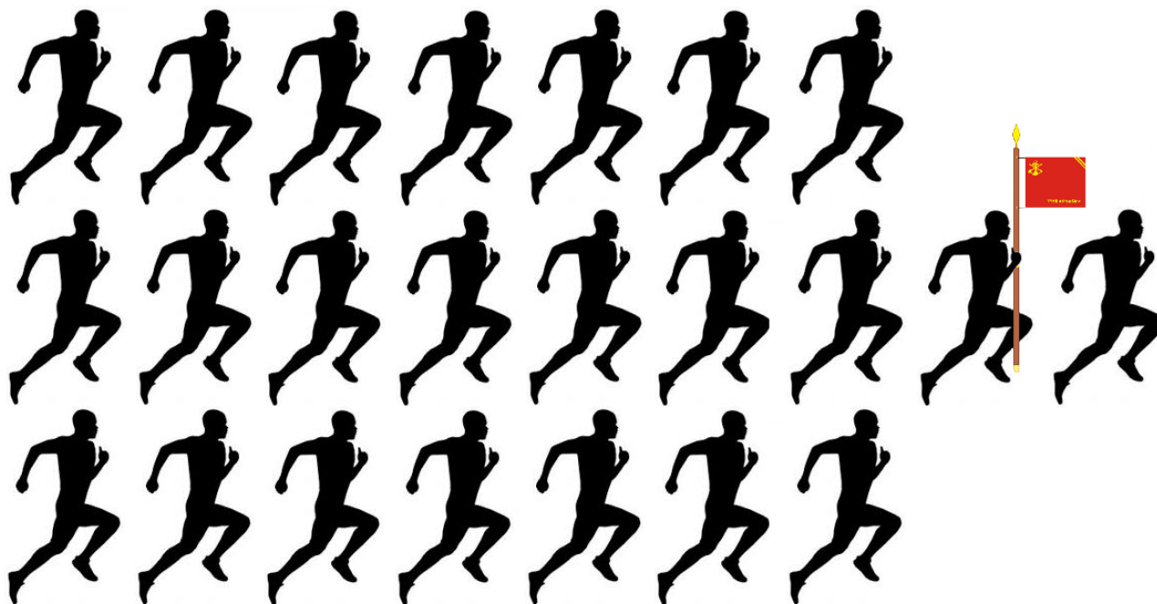
Imagem 2 – Formação dos pelotões militares – 23 pessoas

Artigo 74º. O Capitão pode, eventualmente durante o percurso, correr ao lado do seu pelotão para controlar, motivar e puxar as canções militares.